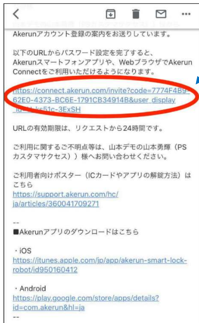
Akerun アカウント設定のご案内